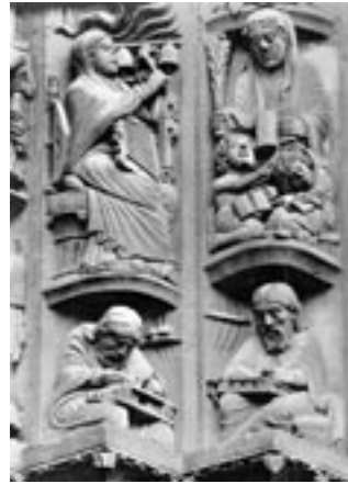
Portaal kathedraal van Chartres

Mettertijd verschuift ook de iconografie. In de eenvoudigste uitvoering is het vooral de thematiek van Christus in Majesteit, standaard gecombineerd met