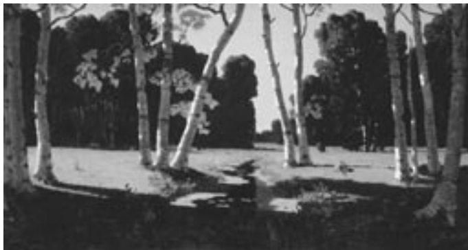
Archip Koeïndzji, Het berkenbos , 1879