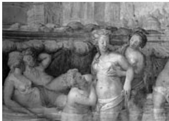
Francesco Salviati, David en Bathseba, 1554, Palazzo Sacchetti, Rome

In deze lezing zullen dergelijke vragen besproken worden aan de hand van dia's van de schilderijen in