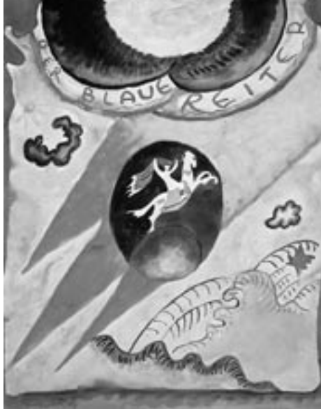
Wassily Kandinsky, Ontwerp voor de omslag van de Almanak, 1911 , Lenbachhaus München

Der Blaue Reiter werd een informele groep van getalenteerde kunstenaars die geen duidelijke theorie hadden, maar wel enkele gemeenschappelijke ideeën. Ze wilden de geestelijke wereld onder de materiële en zichtbare oppervlakte zichtbaar