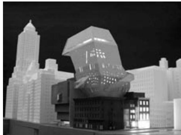
Rem Koolhaas, Whitney museum