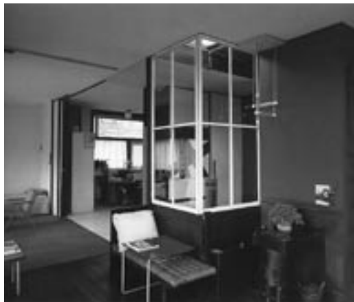
Gerrit Rietveld, Interieur Rietveld-Schröderhuis, Utrecht, 1924