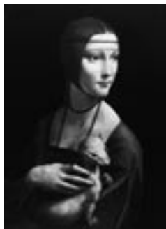
Leonardo da Vinci, Cecilia Gallerani, rond 1484

in deze periode dat 'portret' de betekenis krijgt van een kunstwerk waarin een mens is afgebeeld - een individuele, gelijkende weergave van één of meerdere personen.