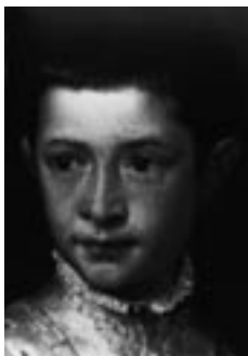
Tiziano, Ranuccio Farnese, rond 1542

In deze lezing onderzoeken we functies en betekenissen van portretten in de vijftiende en zestiende eeuw. In die tijd maakte het portret een bloeiperiode door als zelfstandig genre in de beeldende kunst. Het klassieke denkbeeld dat de mens middelpunt is van de wereld, leefde sterk op. Het is dan ook pas