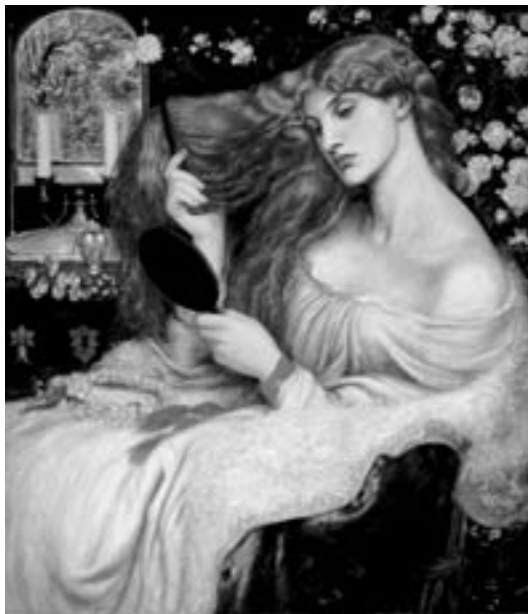
Dante Gabriel Rossetti, Lady Lilith, 1868

Dante Gabriel Rossetti (1828-1882) was een van de oprichters van de zogenaamde Pre-Raphaelite Brotherhood. Deze kunstenaarsgroep zwoer alle aangeleerde academische regels af en pleitte voor een terugkeer naar de natuur. Rossetti's werk is vooral bekend geworden door